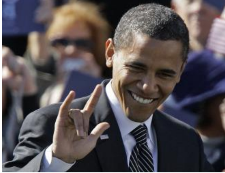
صورة لأوباما وإشارة عبدة الشياطين

بعد البحث والاطلاع في وثائق ونسب عائلة أوباما توصلت الى عدة نتائج وهي كالآتي: باراك حسين أوباما الابن، هو الرئيس الرابع والأربعون للولايات المتحدة الأمريكية من 20 يناير 2009 وحتى 20 يناير 2017، وأول رئيس من أصول أفريقية يصل للبيت الأبيض. حصل على جائزة نوبل للسلام لعام 2009 نظير جهوده في تقوية الدبلوماسية الدولية والتعاون بين الشعوب، وذلك قبل إكماله سنة في السلطة.